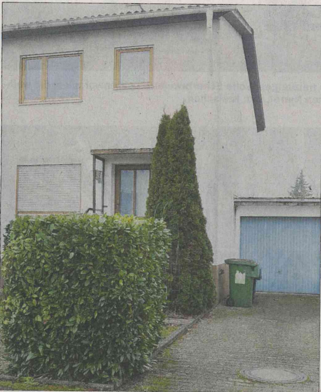
Die Doppelhaushälfte, die verkauft werden soll.

Mit einem Kompromissvorschlag endete die Abstimmung